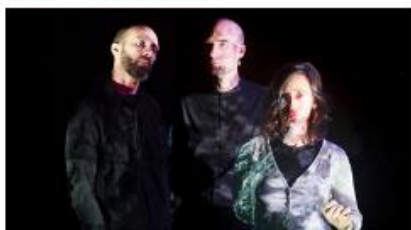
VIRGINIE CLENET / FRONTIÈRES