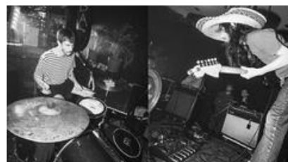
THE FLYING BONES